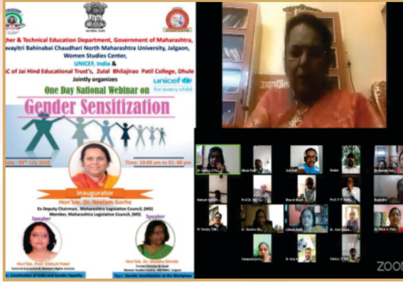
लिंगभाव संवेदनशीलता या विषयावरील आयोजित राष्ट्रीय वेबिनारच्या प्रमुख वक्त्या मा.डॉ.नीलमताई गोन्डे (उपसभापती, महाराष्ट्र विधानपरिषद)