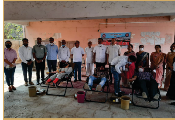
राष्ट्रीय सेवा योजना अंतर्गत आयोजित रक्तदान शिबिरास उपस्थित सन्माननीय संचालक मंडळ