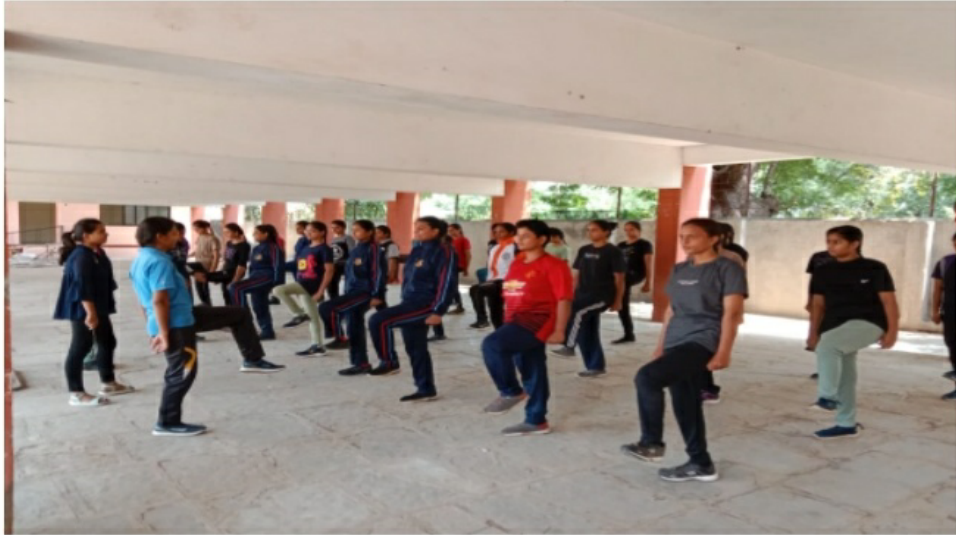
Selection of First Year NCC Cadets