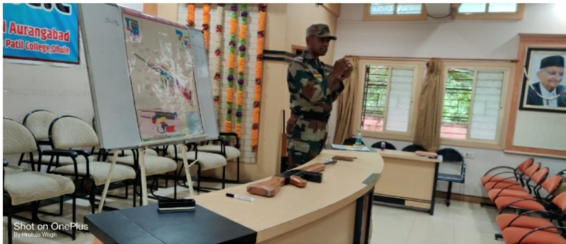
CACT CAMP 2021