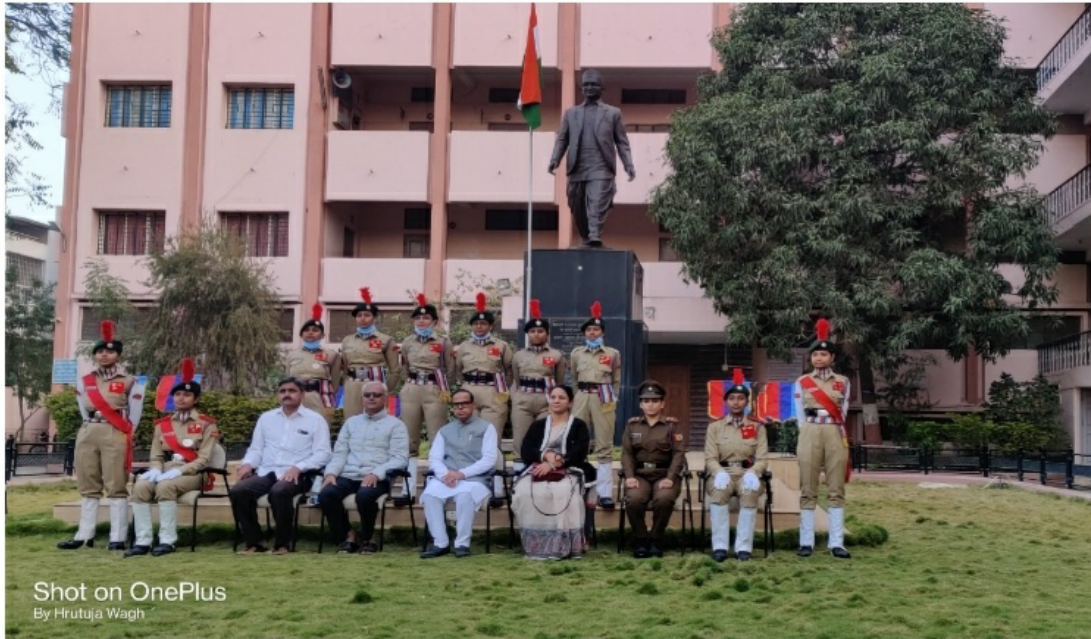
Republic Day Parade 2022