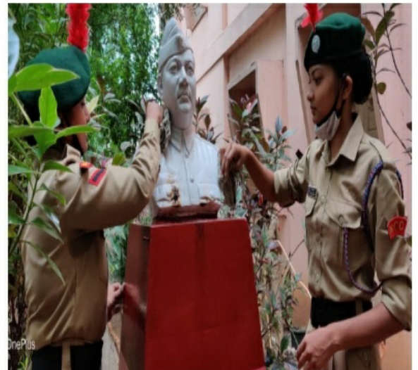
Statue Cleaning Activity