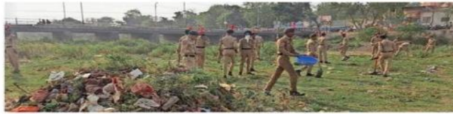
शहरातील पांझरा नदीपात्रात स्वच्छता अभियान राबवताना एन.सी.सी.चे छात्रसैनिक.

छात्रसैनिकांनी पांझरा नदी पात्रातील झुलत्या पुलाच्या समोर स्वच्छता मोहीम राबवली. प्लास्टिक कचरा, काटेरी झुडपे व पान वनस्पतींनी नदीपात्र मुक्त करण्यात आले. मोहिमेत एसएसबीपीएस कला, वाणिज्य व विज्ञान महाविद्यालय, ड्रेड. बी. पाटील महाविद्यालय, विद्यावर्धिनी