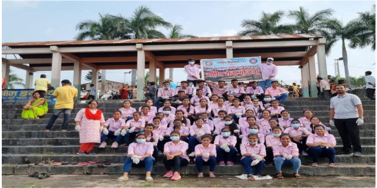
On the occasion of Swaccha Bharat Abhiyan Rangoli competition was conducted by Department of NCC on 14th Oct 2022 .