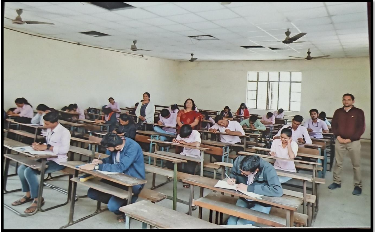
Proverbs & Phrases Competition