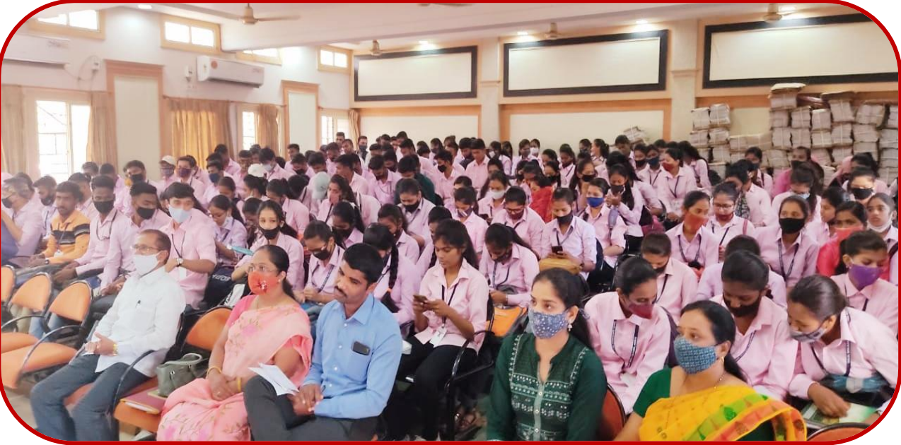
Lecture on “Entrepreneur development through Self Help Groups”, 22/03/2022